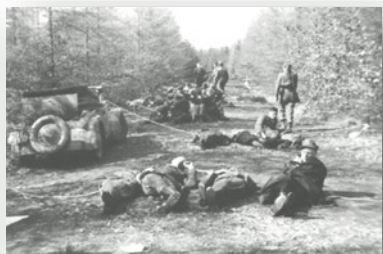
Parachutisten bij Gasselte

Zoek op welke delen van Nederland in januari 1945 al bevrijd zijn. Kleur die delen in op de kaart hierboven.