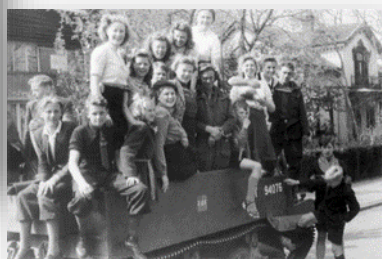
Bevrijding van Meppel

Door wie is jouw woonplaats bevrijd? Omcirkel het antwoord.